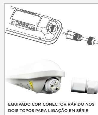
EQUIPADO COM CONECTOR RÁPIDO NOS DOIS TOPOS PARA LIGAÇÃO EM SÉRIE