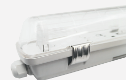
CLIPS DE INOX