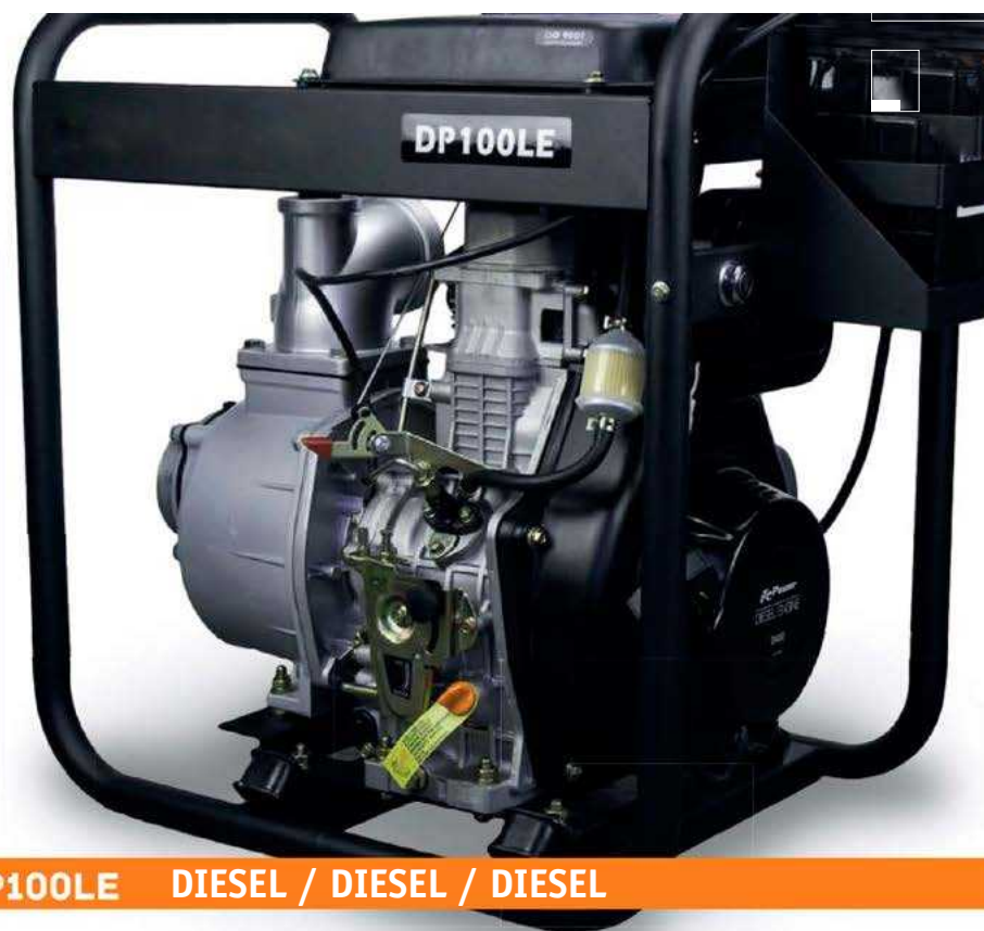
DP100LE DIESEL / DIESEL / DIESEL