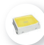
SAMSUNG LED Chip